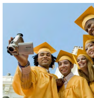
Анализ видеозаписей собственных выступлений