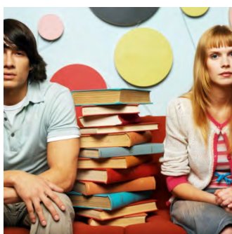
Теоретическое изучение методик и приемов